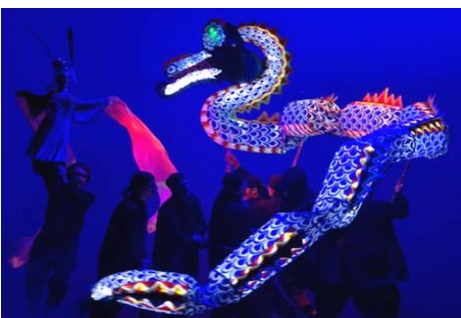
Баталина Евгения, 1а